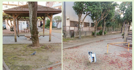
▲整備後の西田公園

原良小学校区の方から、雨の際に山から出た水の排水が上手くできておらず、道路が危険だとのご相談を受けました。鹿児島市田上工事事務所の皆さんと現地調査の上、側溝の蓋を格子状のものと交換してもらいました。