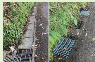
▲原良 / 整備前と整備後の側溝