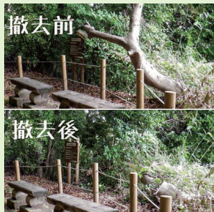
▲城山公園遊歩道の大きな倒木を撤去