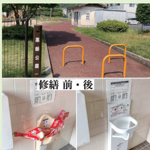
▲業師公園のトイレの修繕

「遠くのディズニーランドやUSJよりも、地元の公園が子どもたちの一番の遊園地だ！」