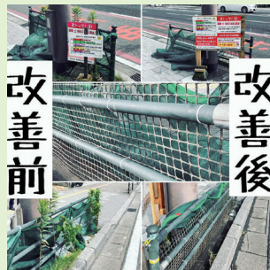
▲ごみ収集場のカラス被害対策