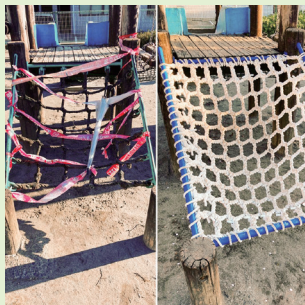
▲城山団地中公園の遊具の修理