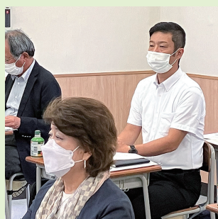
▲不登校対策に関する行政視察

の思いで、週末にゴミ拾いをして回っております。道路や急傾斜地、公園、ゴミステーションなど様々な場所を自らの目で足で確認しております。視察して欲しい場所があれば遠慮なくご連絡ください。