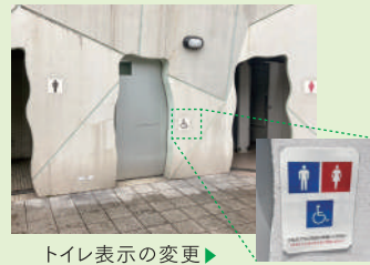
トイレ表示の変更▶